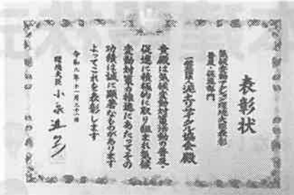
気候変動アクション 環境大臣表彰表彰状

泥土リサイクルに関する資料につきましては、各種取りそろえておりますので、事務局までお問い合わせください。